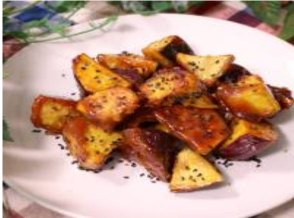
サツマイモを“つけた”“おかし”