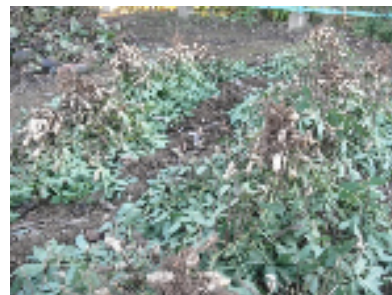
落花生の収穫 10月16日