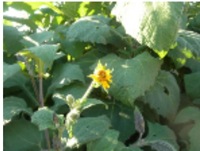
ヤーコンの花 10月16日