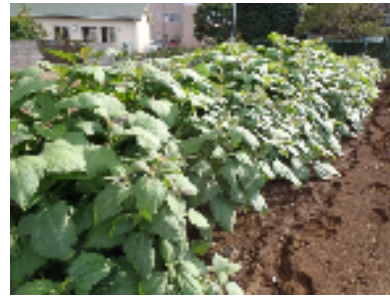
ヤーコンの状況 10月31日